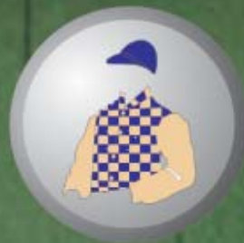
FIGUEIRA DO LAGO