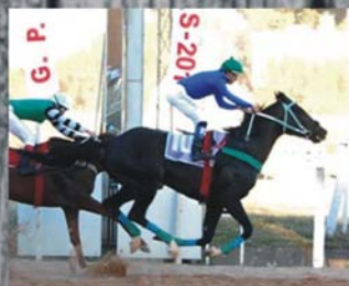
Quanto Mais leva o GP Bento/ 2010