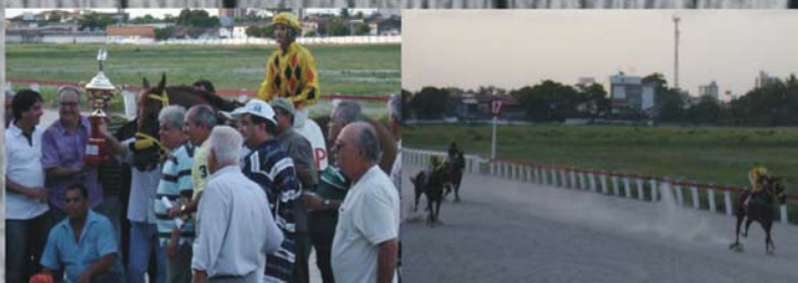
Dia Sonhado com a farda do Stud Cortez Pe é o melhor no Clássico José Maria Sampato em Madalena