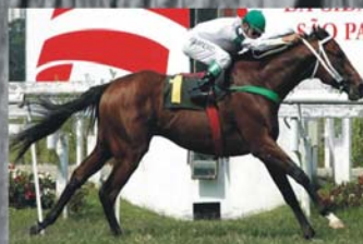
Puro Galope conquista a PE Cacique Negro

INFORMAÇÕES (11) 9977-2512 prohorse@uol.com.br www.prohorse.com.br