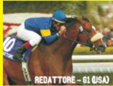
REDATTORE - G1 (USA)