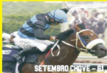
SETEMBRO CHOVE - G1