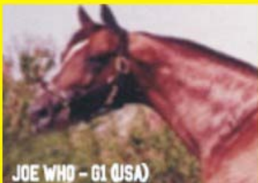
JOE WHO - G1 (USA)