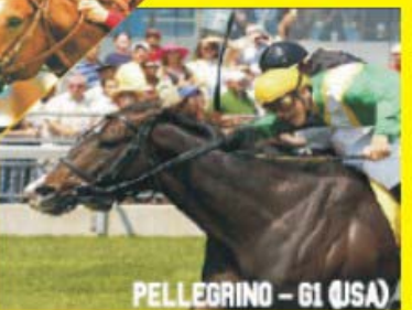
PELLEGRINO - G1 (USA)