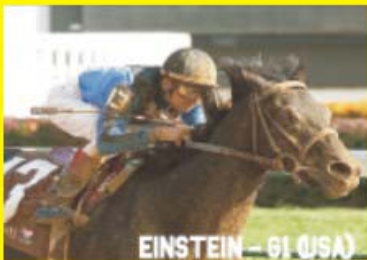
EINSTEIN - G1 (USA)