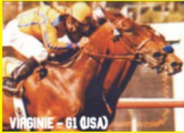
VIRGINIE - G1 (USA)