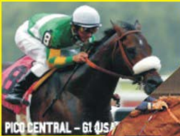
PICO CENTRAL - G1 (USA)