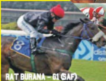
RAT BURANA - G1 (SAF)