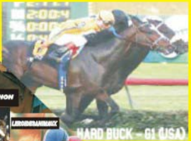
HARD BUCK - G1 (USA)