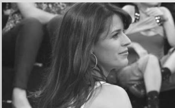
No Programa Altas Horas de Serginho Groisman