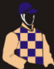
Hs. Figueira do Lago