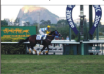
TUDO AZUL (filho de Boatman)

Vencendo - GP ABCPCC, G1 Lider da Geração na Gávea entre os potros