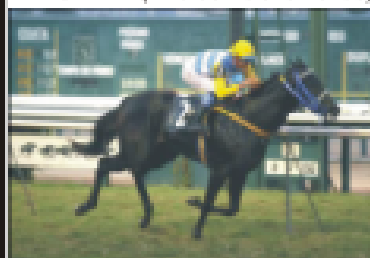
INEGRITA (filha de Publico Purse)